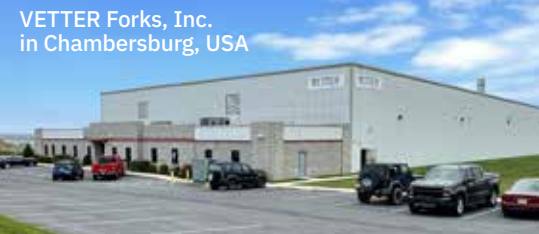
VETTER Forks, Inc. in Chambersburg, USA