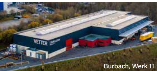
Burbach, Werk II