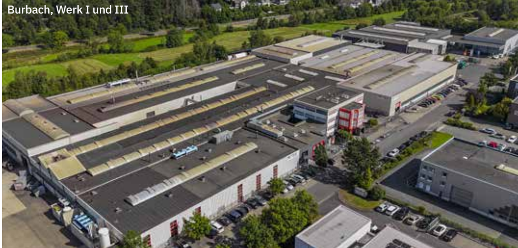
Burbach, Werk I und III

VETTER Industrie GmbH Carl-Benz-Straße 45 57299 Burbach / Germany