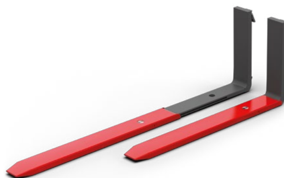
ManuTel® G2 edición SlimLine