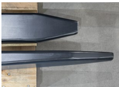
Punta de la prolongación moldeada y biselada