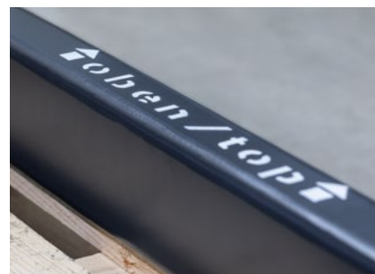
Indicación del sentido correcto de montaje