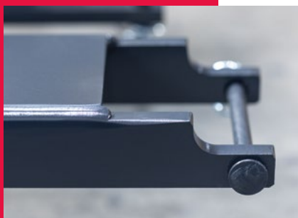
Soporte de montaje anticolidión