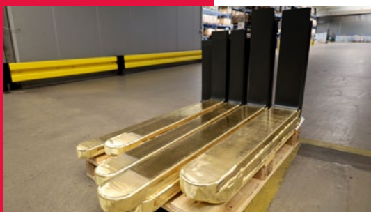
BELUGA gaffel med mässingsbeklädnad