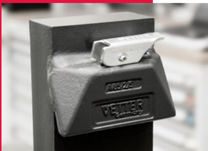
VETTER Arretierung und Gabelhaken