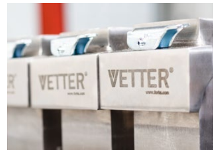
Optional: Gabelhaken aus 100 % Edelstahl