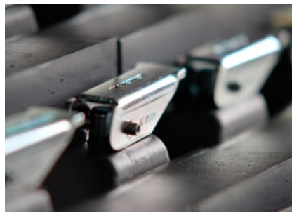
Schließmechanismus mit VETTER Arretierung