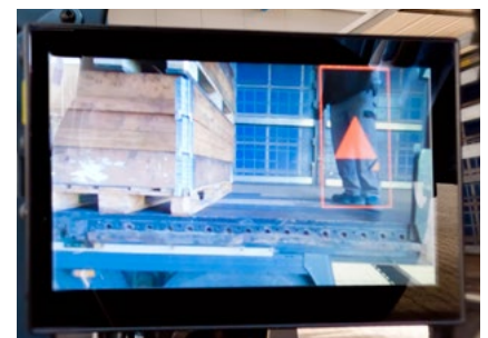
Monitoransicht im Fahrerhaus zeigt die Personenerkennung