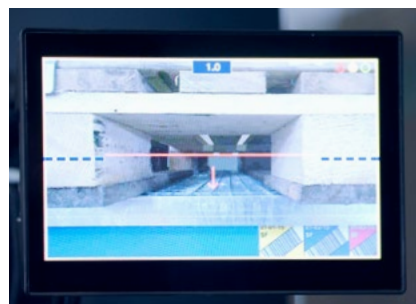
Monitoransicht im Fahrerhaus zeigt die Neigungsanzeige der Gabelspitze