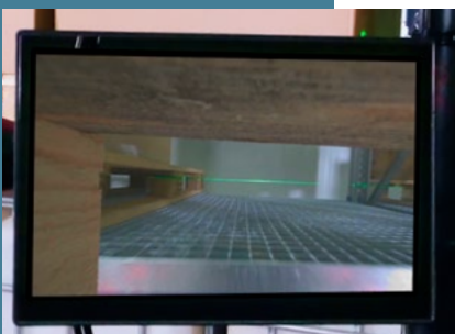
Monitoransicht im Fahrerhaus zeigt die Sicht vor die Ladung