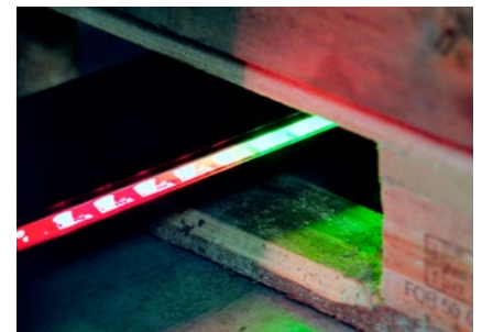
... zur Einfahrtiefenbestimmung