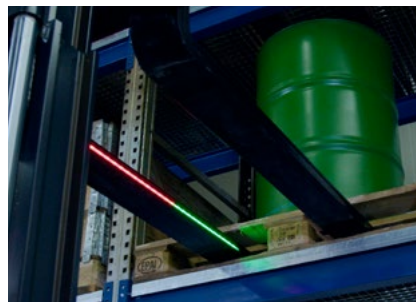
Innenliegende LEDs ...