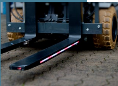
LEDs seitlich in der Gabelzinke integriert