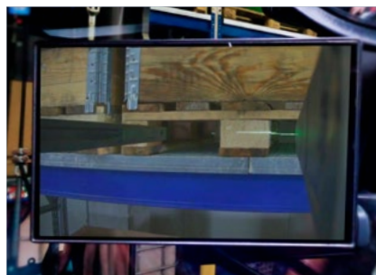
SideCam – Einfahrtaschen entlang der Gabelzinke anvisieren