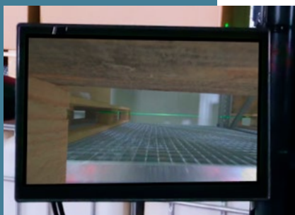
FrontCam – Sicht vor die aufgenommene Ladung