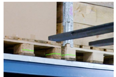
Laser – Palette mittels grünem Laser anvisieren