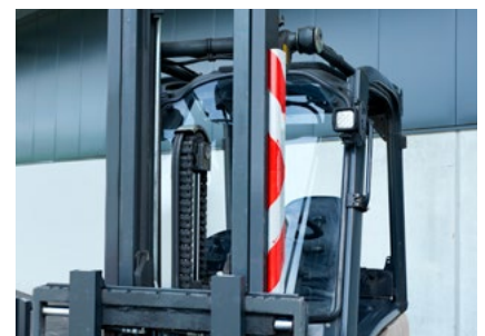
Einfach am Stapler befestigen