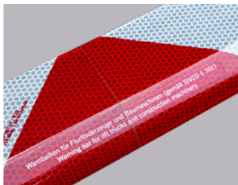
Von Weitem sichtbar: Spezial-Reflektorfolie nach StVZO §30c

Nur mit einer gemäß StVZO §30c vorgeschriebenen Warneinrichtung dürfen Flurförderzeuge auf öffentlichen Straßen fahren.