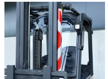
ZEBRA bei Nichtbenutzung einfach am Stapler befestigen!