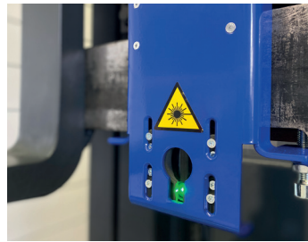
Laser en croix, vert et classe 1M