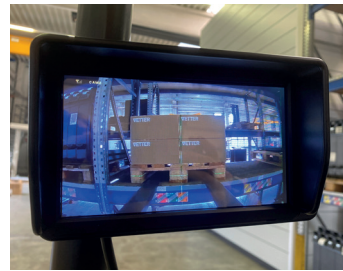
Ecran dans la cabine