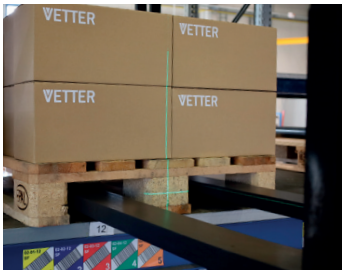
Viser à l'aide d'un laser en croix