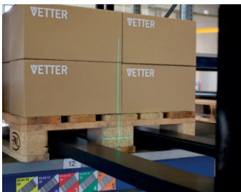
Präzises Anvisieren mittels Kreuzlaser