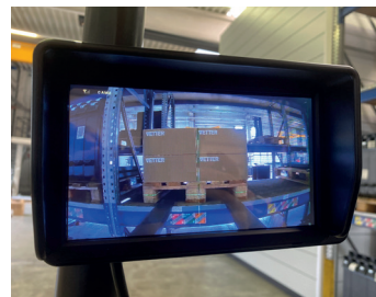
Monitoransicht im Fahrerhaus