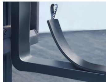
Con una lengüeta para levantarlo sencillamente