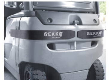
También utilizable como protección contra golpes para el chasis de la carretilla