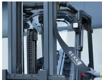
Cuando no se usa, simplemente se adhiere a la carretilla